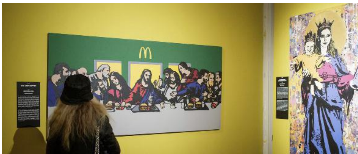
La mostra 'Jago, Banksy, TVboy e altre storie controcorrente' a Palazzo Albergati prosegue fino a maggio

mondo sotterraneo dei Bagni di Mario. Conosciuto anche come Conserva di Valverde, il magnifico percorso mostra i sistemi di capostazione e di raccolta delle acque che consentivano l'approvvigionamento idrico della fontana del Nettuno. Visite guidate nei weekend di gennaio e febbraio, info e prenotazioni: 329 3659446 - associazione.vitruvio@gmail.com.